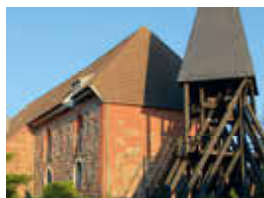
St. Michaelis Kirche Hohenaspe

Ich freue mich auf viele Begegnungen in den unterschiedlichen Gemeinden und darauf, das Zusammenwachsen und die Zukunft des Pfarrverbundes mitzugestalten.