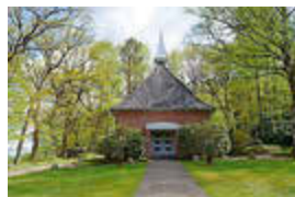
Martin Luther Kirche, Mehlbek