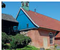
St. Marienkirche Heiligenstedten