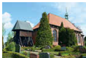
St. Georg Kirche Krummendiek